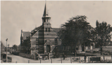
Synodaal Gereformeerde Kerk