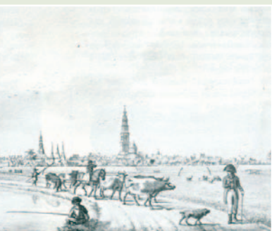
Achtergrond de stad Groningen. (ca 1813)

de afgescheiden (gereformeerde) tak, ook nog in het dorp de Vrijgemaakt Gereformeerde Kerk (Asingastraat) en de Synodaal Gereformeerde Kerk (hoek Leensterweg - Schapenweg).