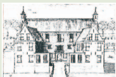
Asingaborg toen en nu

vroeger het terrein van de Asingaborg. Het huis werd het