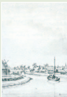
De trekschuit met in de e