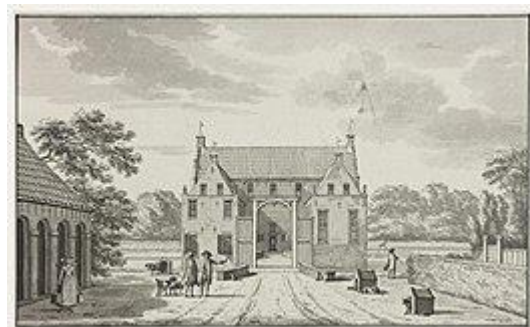
In 1809 kwam, op afbraak, te koop "het hoog adelijk huis Azinga te Ulrum".

Een belangrijk gegeven in de ontwikkeling van Ulrum is de liquidatie van het huis Asinga geweest. Na de Franse tijd waren veel van de oude rechten van de adel wel weer hersteld, maar de adel in Groningen had vóór die tijd, in de 18 e eeuw, een economische achterstand opgelopen waardoor ze zich ten opzichte van de nieuwe bovenlaag van de 19 e eeuw (hoge burgerij en grote boeren) niet kon handhaven. Dat had mede te maken met de manier waarop de staten van Groningen in de 18 e eeuw de verkoop van het enorme grondbezit van de kloosters - dat na de reformatie in de 16 e eeuw in bezit van de provincie was gekomen - had afgehandeld en met het daarmee in verband staande pachtsysteem (beklemrecht).